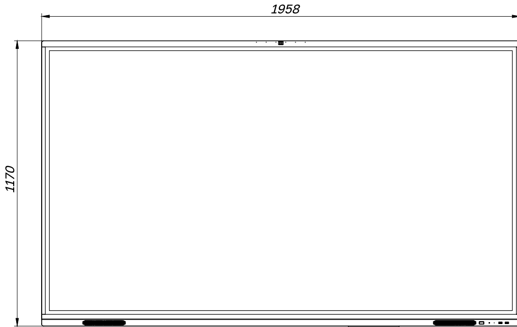
СХЕМА ПАНЕЛИ (ВИД СПЕРЕДИ)